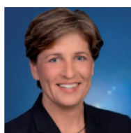
Nicole Razavi, MdB Sprecherin für Verkehr und Infrastruktur der CDU-Landtagsfraktion Baden-Württemberg