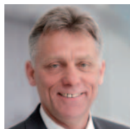
Klaus Sedelmeier Vorsitzender des WBO